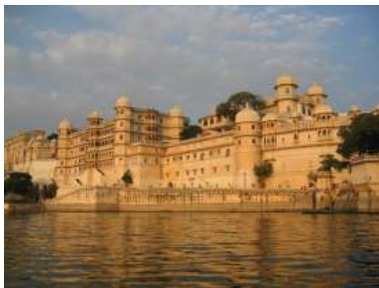
Regreso al Hotel. Resto de la tarde libre. Alojamiento.

Desayuno tipo buffet en el hotel. Seguimos por la mañana City Tour de la ciudad de Udaipur con una visita al Palacio de la Ciudad , un enorme edificio situado en una colina, en la orilla del lago Pichola y rodeado de murallas, construido en 1559 y compuesto por diferentes salas, templos y jardines. Paseo alrededor del Lago Fatehsagar y Visita exclusiva al Cristal Museum (City Palace).