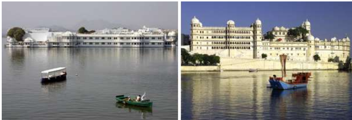
Regreso al hotel. Alojamiento.

Disfrutaremos de un crucero en motora, por las plácidas y místicas aguas del Lago Pichola. Desde la embarcación podrán ver, la ciudad de Udaipur crecer majestuosamente alrededor del lago, en medio del desierto de Rajastán. (El paseo en la motora está sujeto a las condiciones del nivel del agua).